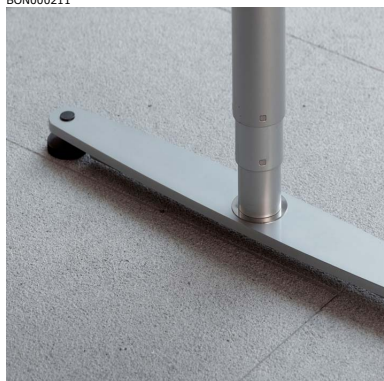
Detalj av stativ i ljusgrå metall