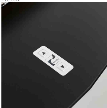
Reglage för höjdjustering