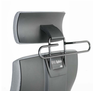
Nackstöd, baksida av svart plast.