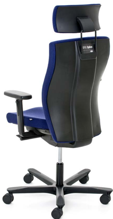
K06G20 EFG Splice 20, rygg med baksida av svart plast