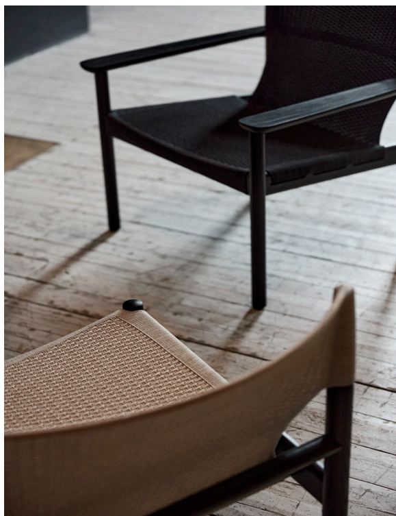
Alla utföranden av träslag och tyg kan kombineras.