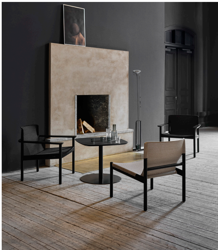
Vackra och funktionella fästdetaljer i fjäderstål gör att textilen kan bytas vid behov.