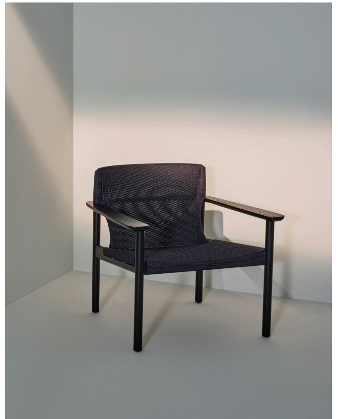
Evo är gjord i trä, i varianterna ask, ek eller svartbetsad ask. Fåtöljen finns med eller utan armstöd.