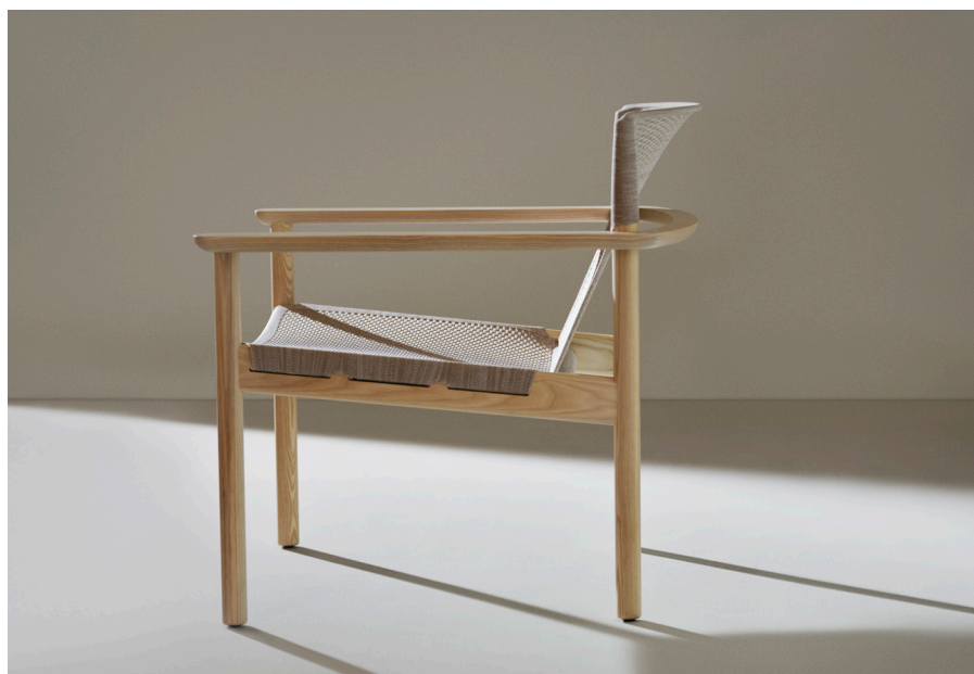
Tyget till sits och rygg är 3D-stickat i ett enda stycke som fästs i trästommen. Tyg i färger beige melange eller svart melange.