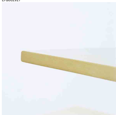
S-utförande = rak kant