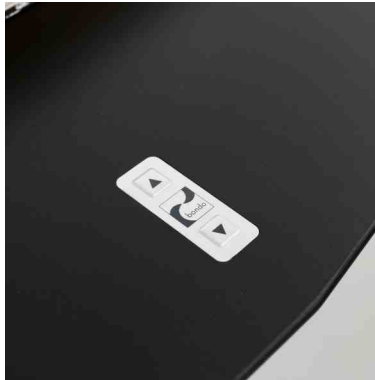
Reglage för höjdjustering