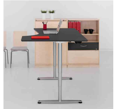
Arbetsbord, motordriven höjdjustering