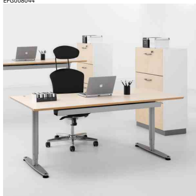
Arbetsbord med kabeldike